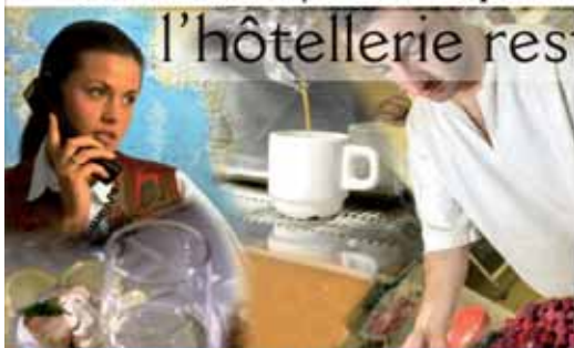
Formation qualifiante pour jeunes et adultes aux métiers de l'hôtellerie et de la restauration